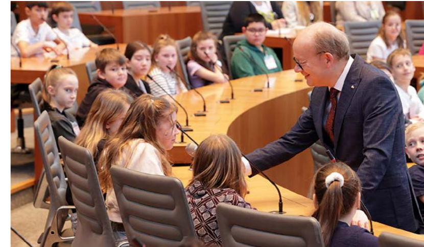
Der Präsident im Gespräch mit den Schülerinnen und Schülern der Siegerklassen

Die Fuchsklasse 4a der Kardinal-von-Galen-Schule Lünen kam auf den vierten Platz und erhielt 150 Euro für die Klassen-