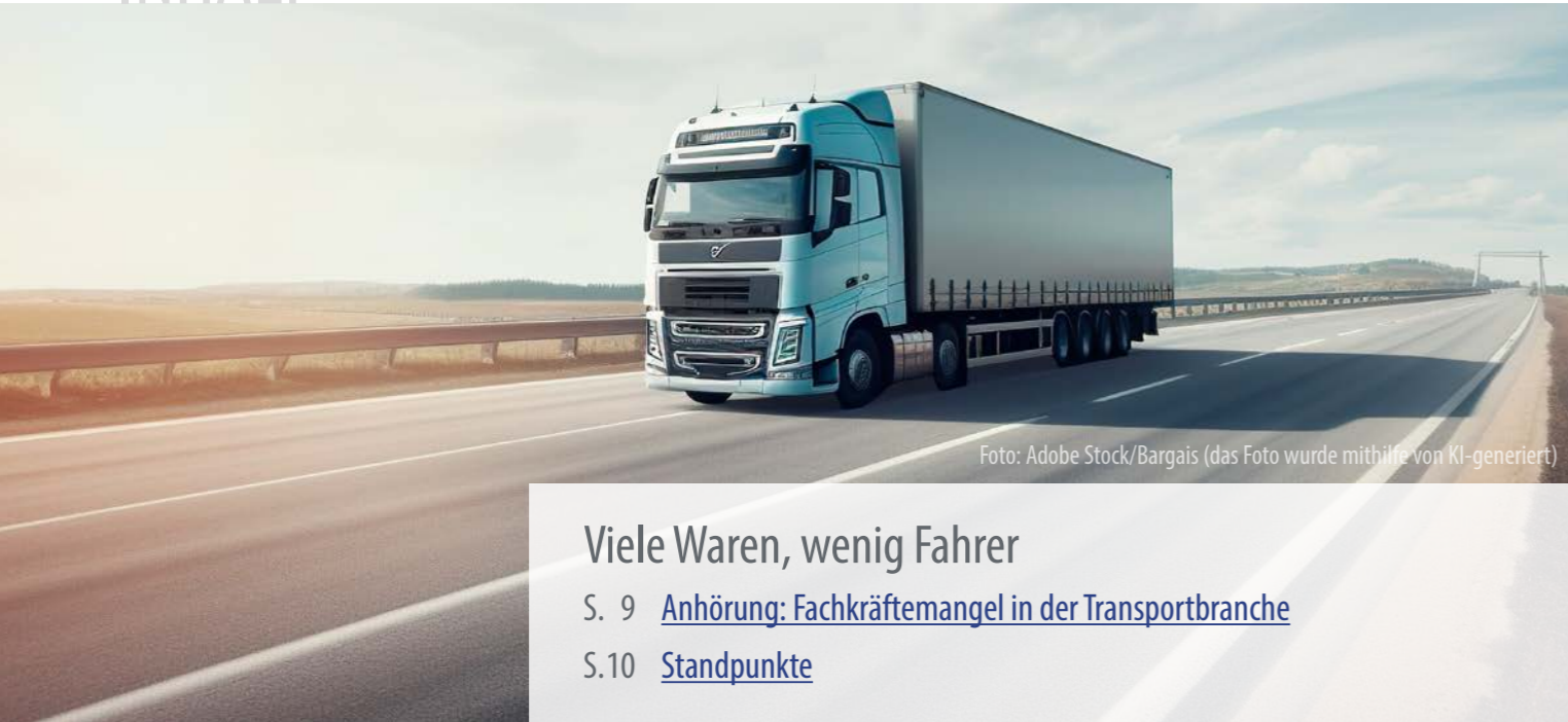
Foto: Adobe Stock/Bargais (das Foto wurde mithilfe von KI-generiert)