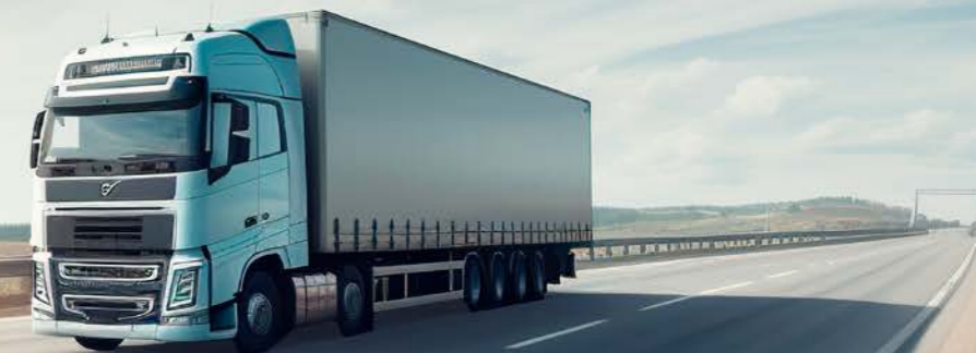
(das Foto wurde mithilfe von KI-generiert)

Die Vereinte Dienstleistungsgewerkschaft (ver.di) begrüßt die Intention des Antrags der Fraktionen. Arbeitsbedingungen in der Branche müssten verbessert werden. Bisher sei der Fachkräftemangel durch Personal aus dem Ausland ausgeglichen worden. Dadurch verschiebe sich das Problem aber „weiter in Richtung Osteuropa“. Polen beklage aktuell einen Mangel von rund 124.000 Fachkräften.