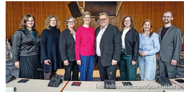
Der neue Vorstand der Grünen Landtagsfraktion