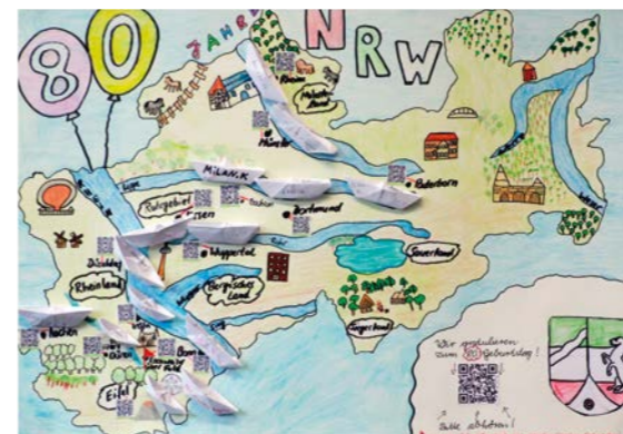
Platz 3: GGS Albertus Magnus Nörvenich, Eulenklasse 4b