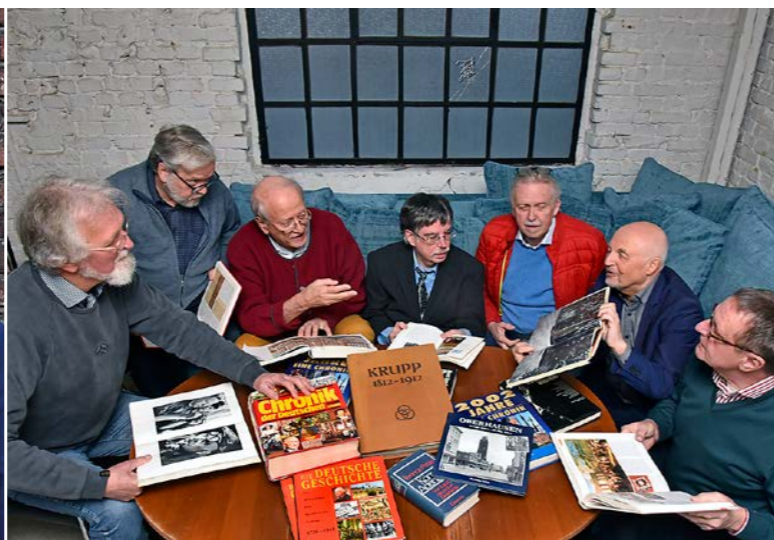
Die Mitglieder von „ProDemokratie“ treffen sich regelmäßig zum Austausch

2024 war es dann so weit – die Gruppe stellte sich der Öffentlichkeit vor. Mittlerweile seien Schulen und Kirchen im Boot, Wirtschaft und Gewerkschaften, Privatleute. Der E-Mail-Verteiler umfasse 40 Gruppen und Einzelpersonen. Man trete ein „für ein