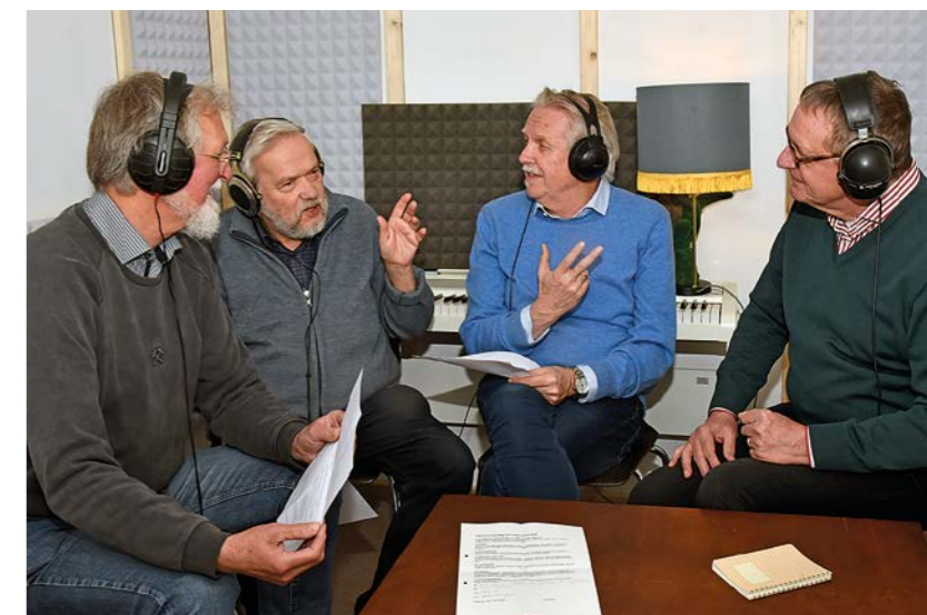
Podcast-Aufnahme im Studio

Zurück zu Yoda, dem weisesten Jedi aller Zeiten. Ihn spannten die Frauen und Männer von „ProDemokratie“ unter anderem vor der Bundestagswahl am 23. Februar 2025 ein. „Die Wahlbeteiligung war in den Jahren zuvor rückläufig“, sagt Dyhringer, „wir wollten mehr Menschen bewegen zu wählen.“ Und ihnen nahelegen, dass man im Wahlrecht gewissermaßen auch eine Pflicht sehen könne. Witzig sollte die Wahlwerbung sein. Vor allem aber sollte sie verstanden werden. Die Initiative verteilte schließlich Postkarten, auf denen Yoda die Menschen aufforderte: „Wählen gehen du musst!“ Der Satz habe ihn als gelernten Deutschlehrer zunächst irritiert, gesteht Dyhringer. Aber dann habe es doch „Klick“ gemacht. Der gewagte Satzbau sei eben typisch für den Jedi-Meister. zab