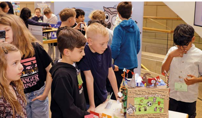
Die Siegerarbeiten und 21 weitere wurden in einer Ausstellung gezeigt.

27. Februar 2026 – Nordrhein-Westfalen feiert in diesem Jahr seinen 80. Geburtstag. Was macht das Bundesland für Kinder besonders? Was verbinden sie mit Nordrhein-Westfalen? Darum ging es beim Mal- und Bastelwettbewerb 2025/2026. Über den ersten Preis kann sich die Bees-Klasse 4b der Carolinenschule Bochum freuen. Die Plätze zwei bis vier belegen Grundschulen aus Duisburg, Nörvenich und Lünen.