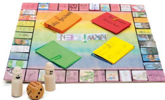
Platz 2: KGS Grabenstraße Duisburg, Schildkrötenklasse 4b