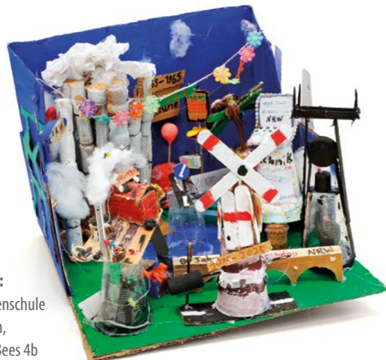
Platz 1: Carolinenschule Bochum, Klasse Bees 4b