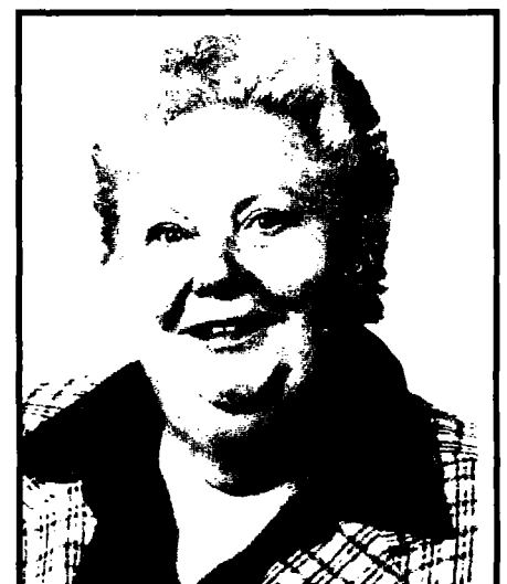
Sigrid Klösge (SPD)

Die Sozialdemokratin Sigrid Klösge, die als Berufsbezeichnung für den Landtag ihre Arbeit als Hausfrau angab, war im größten Teil ihres Berufslebens als selbstständige Generalagentin eines Versicherungsunternehmens tätig. Sie setzte Zeichen durch unermüdlichen Einsatz auf kommunaler Ebene und in der Landespolitik, ohne sich ins Rampenlicht der Öffentlichkeit zu drängen. Ihre Fraktionskollegen schätzten ihr freundliches Wesen und ihre Loyalität gegenüber den Anliegen der Bürgerinnen und Bürger, deren Interessen sie vertrat.