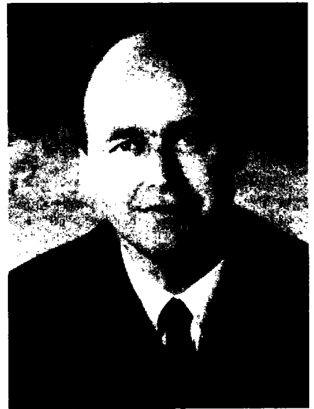
Vizepräsident Laurenz Meyer

Kommunalpolitisch war der Vater von vier Kindern zwei Jahrzehnte von 1975