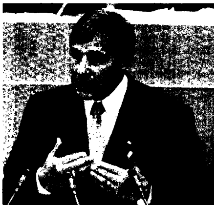
„Lassen Sie uns aus unserem Land nicht nur ein Vorbild für wirtschaftliche Innovation und technischen Wandel machen. Machen wir Nordrhein-Westfalen auch zu einem Vorbild für Weltoffenheit und Liberalität“ – Appell des Ministerpräsidenten Wolfgang Clement in seiner Regierungserklärung vor dem Landtag.

Börsengeschehen: „Der shareholder value ist aus sich heraus nicht wertorientiert. Für den politischen DAX sind wir verantwortlich. Und wir werden uns dann messen lassen, ob unsere Aktien noch hoch im Kurs stehen oder nicht.“