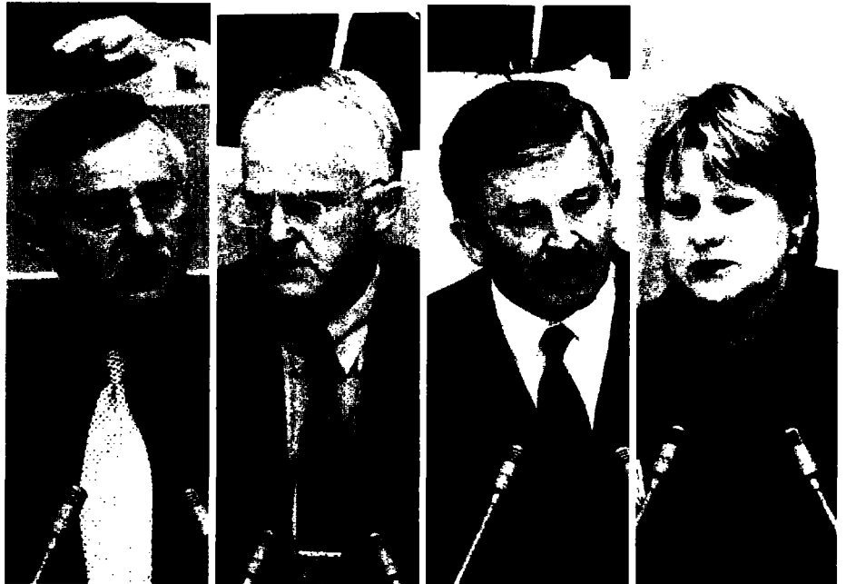
Bündnis gegen Gewalt und Hass: v.l. Edgar Moron (SPD), Dr. Jürgen Rüttgers (CDU), Jürgen W. Möllemann (FDP) und Sylvia Löhrmann (GRÜNE).