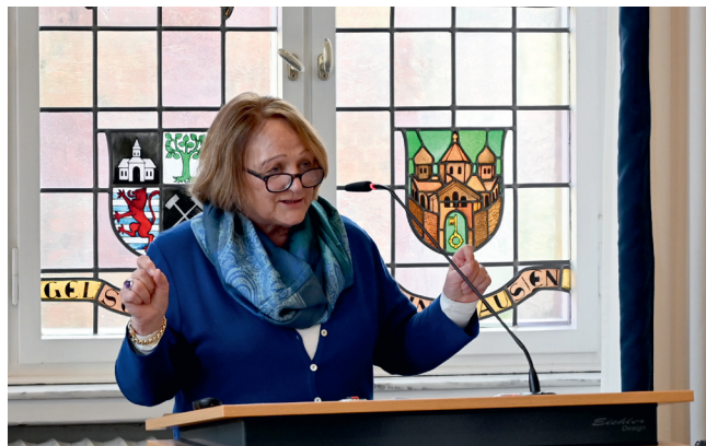
Sabine Leutheusser-Schnarrenberger bei der Kommunaltagung am 7. Dezember 2022 in der Bezirksregierung Münster

der Servicestelle für Antidiskriminierungsarbeit mit dem Schwerpunkt Antisemitismus. Sie bietet Beratung für Betroffene von Antisemitismus und Diskriminierung in der Region Westfalen Lippe sowie anlassbezogene Fachberatung bei antisemitischen Vorfällen an.