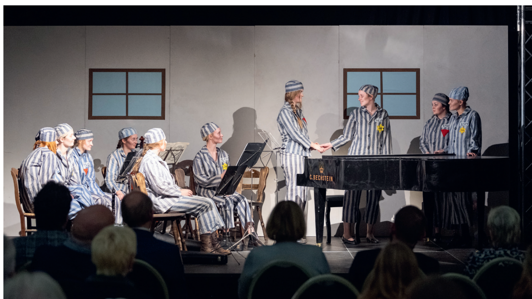
Aufführung Junges Ensemble Mariengarden – Zeitspiel

Das Theaterstück bringt den Zuschauerinnen und Zuschauern den Alltag im KZ sehr nahe und berührt auf persönlicher Ebene. Es gibt einen Einblick in das Leben dieser 13 bis 20 Jahre alten jungen Frauen und ruft die Grausamkeit des Nationalsozialismus ins Gedächtnis. Es berührt damit insbesondere seine jugendlichen Zuschauerinnen und Zuschauern.