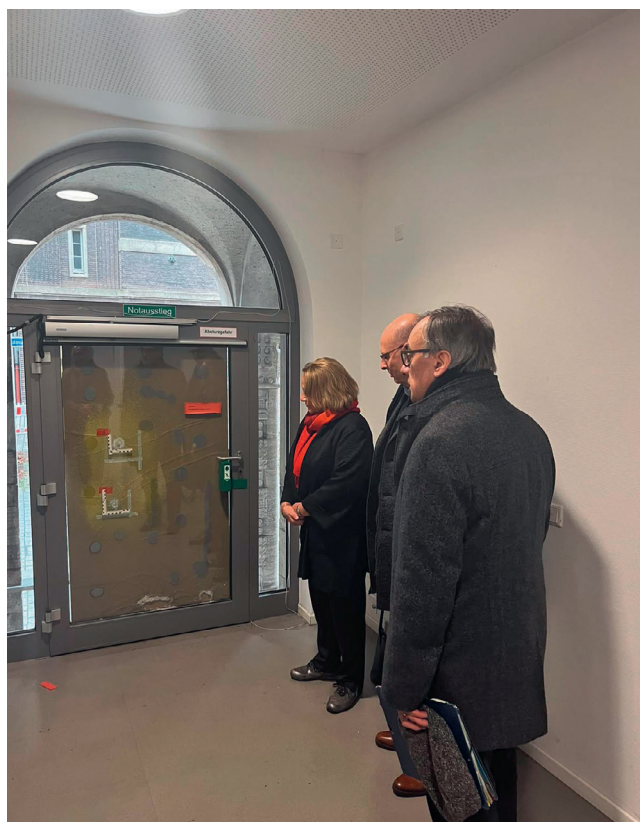
Tür des alten Rabbinerhaus in Essen am 29. November 2022

Steinheim-Institut für deutsch-jüdische Geschichte sowie Räume der Universität Duisburg-Essen untergebracht. 35 Obwohl die Räumlichkeiten der Alten Synagoge von der jüdischen Gemeinde Essen lediglich zu besonderen Anlässen genutzt werden, stellt die Alte Synagoge ein wichtiges Symbol für das jüdische Leben in Deutschland dar. Die unmittelbaren Reaktionen der Sicherheitsbehörden haben diesem Umstand Rechnung getragen und gezeigt, dass hier der Kontext richtig eingeordnet wurde. Daher war und ist es unerlässlich, dass sich, nach Bekanntwerden des Anschlags, alle Behörden auf allen Ebenen schnell austauschten und abgestimmt haben. Der Generalbundesanwalt beim Bundesgerichtshof (Generalbundesanwalt) hat in Gänze die Ermittlungen am 02. Dezember 2022 übernommen. 36 Über die Schüsse auf das Rabbinerhaus hinaus gab es in einem engen zeitlichen Zusammenhang noch weitere Anschläge mit antisemitischem Hintergrund im Ruhrgebiet. 37 Eine lückenlose Aufklärung zu den Angreifern und Hintergründen der Tat ist unerlässlich.