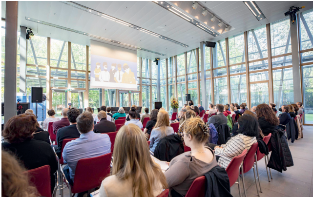
Fachtagung in der Landesvertretung Berlin am 21. September 2022

Seit Beginn der Corona-Pandemie wird Antisemitismus immer wieder offen zur Schau gestellt: Auf Demonstrationen werden Opfer der Shoah verhöhnt und Verschwörungstheorien verbreitet. Sicherheitsbehörden und zivilgesellschaftliche Organisationen verzeichnen schon lange einen alarmierenden Anstieg antisemitischer Taten. Die Erscheinungsformen und Tatorte sind vielfältig: Sie reichen von Propagandadelikten im öffentlichen Raum und Hate Speech im Internet über Anschläge auf