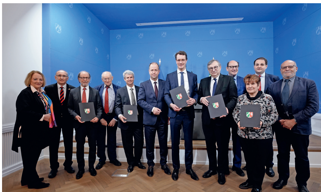
Vertragsunterzeichnung des Sechsten Änderungsstaatsvertrags zwischen den Jüdischen Landesverbänden und dem Land Nordrhein-Westfalen, Foto: LandNRW/Günther Ortman

Kurz nach dem Anschlag auf die Alte Synagoge wurden die Sicherheitsvorkehrungen an den Synagogen und jüdischen Einrichtungen in Nordrhein-Westfalen überprüft. Im Bedarfsfall verstärkte die Polizei den Streifendienst und setzte weitere Sicherheitsmaßnahmen zügig um. 41 Erkenntnisse hinsichtlich eines möglichen unmittelbar bevorstehenden Anschlags gegen jüdische Einrichtungen oder andere Gotteshäuser liegen den Sicherheitsbehörden aktuell nicht vor. Jedoch ist im Allgemeinen weiterhin von einer hohen abstrakten Gefährdungslage auszugehen. 42