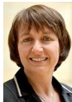
Monika Düker (Fraktion Bündnis 90/ Die Grünen) - Sprecherin -