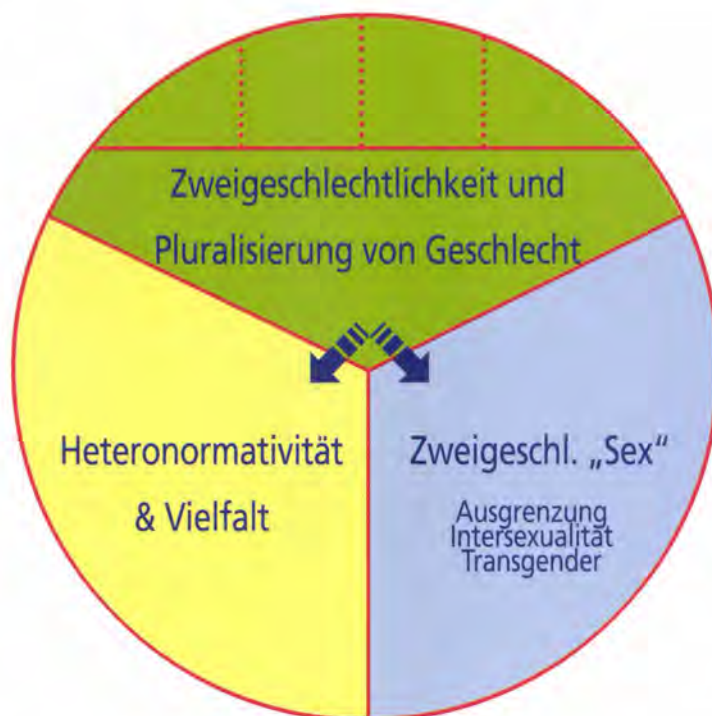
Schaubild 4: Die drei Dimensionen von Geschlecht in der flexibilisierten Geschlechterordnung

des Geschlechts und des Begehrens. Verschiedene geschlechtliche Stilisierungen werden zumindest in postmodernen Milieus möglich. Homosexualität wird als private Lebensform weithin anerkannt. Dennoch wirken die Zweigeschlechtlichkeit und die mit ihr verbundene Heteronormativität weiterhin hegemonial, wenn auch relativiert.