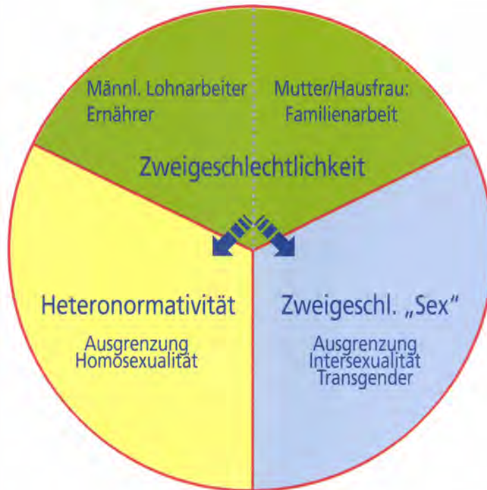
Schaubild 3: Die drei Dimensionen von Geschlecht in der differenzbegründeten Geschlechterordnung

Die vielfachen Ursachen hängen mit der weiteren Modernisierung zu einer organisierten Moderne (Wagner 1995) zusammen und können hier nur knapp angedeutet werden. Im Zuge der Demokratisierung erreichten Frauen Zugang zu höherer Bildung und zum Wahlrecht. Der fordistische Kapitalismus schuf einen Massenarbeitsmarkt, der auch Frauen als einfache oder angelernte Arbeitskräfte zunehmend einbezog. Zugleich griffen sie die rasch zunehmenden Büro- und Angestelltenberufe auf. Zwar war die weibliche Erwerbstätigkeit teils auf die Zeit vor der Heirat oder bis zum ersten Kind beschränkt. Aber mit der steigenden Bildung eröffnete sie Frauen ein wachsendes Selbstbewusstsein.