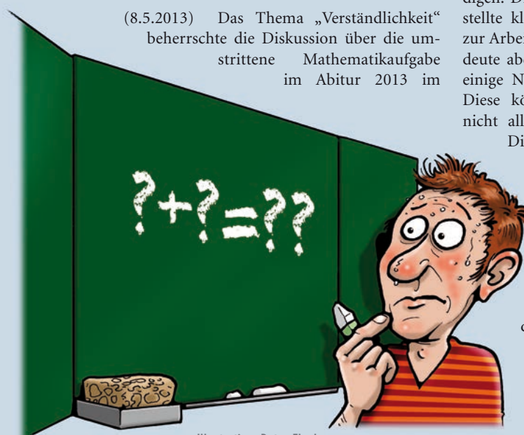
Illustration: Peter Flock

(8.5.2013) Das Thema „Verständlichkeit“ beherrschte die Diskussion über die umstrittene Mathematikaufgabe im Abitur 2013 im