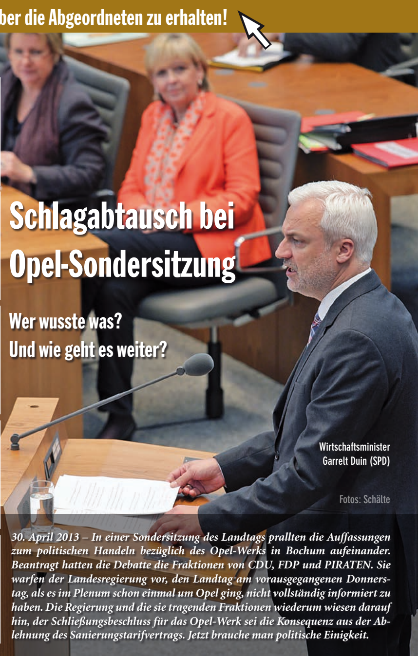
Wirtschaftsminister Garrelt Duin (SPD)

30. April 2013 – In einer Sondersitzung des Landtags prallten die Auffassungen zum politischen Handeln bezüglich des Opel-Werks in Bochum aufeinander. Beantragt hatten die Debatte die Fraktionen von CDU, FDP und PIRATEN. Sie warfen der Landesregierung vor, den Landtag am vorausgegangenen Donnerstag, als es im Plenum schon einmal um Opel ging, nicht vollständig informiert zu haben. Die Regierung und die sie tragenden Fraktionen wiederum wiesen darauf hin, der Schließungsbeschluss für das Opel-Werk sei die Konsequenz aus der Ablehnung des Sanierungstarifvertrags. Jetzt brauche man politische Einigkeit.